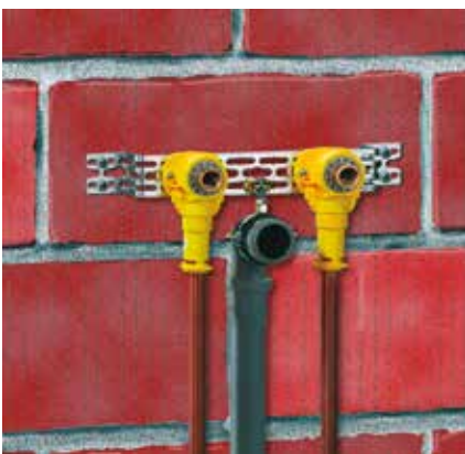
Waschtischinstallation: Alles genau auf Stichmaß montiert