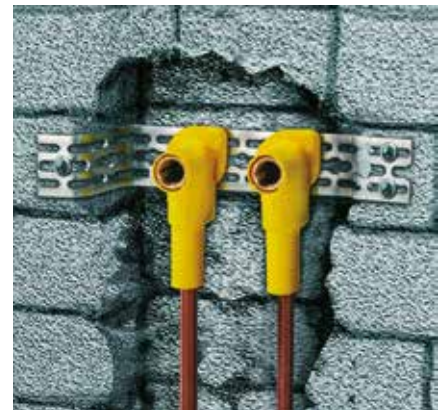
Waschtischinstallation: Installation in engen Maueraussparungen