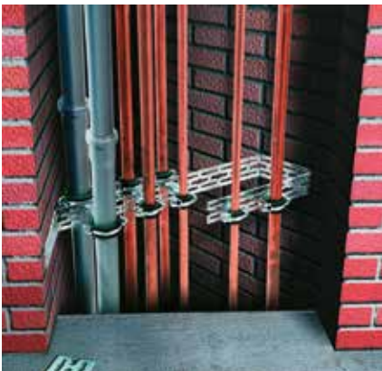
Montage im Schacht: Durchsteckmontage mit zwei Rohrschellen und einem Gewindestift M8 oder M10 für die Befestigung paralleler Rohrleitungen