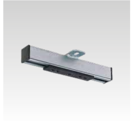
Glissière coulissante M10