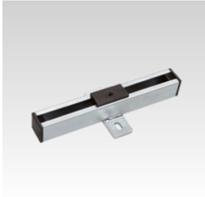
Glissière coulissante M8