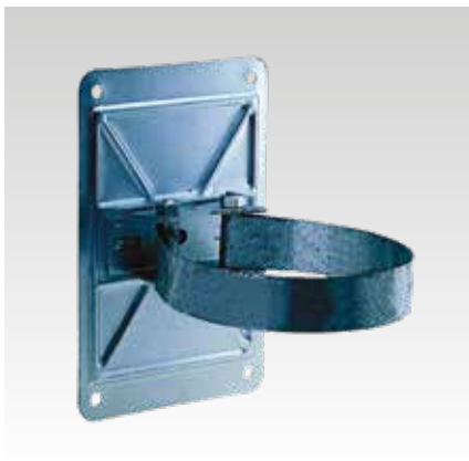
Montage avec bande de serrage ML