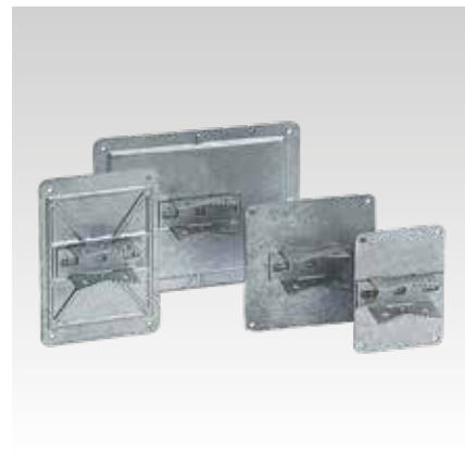
Pour profils 38/24 à 40/120